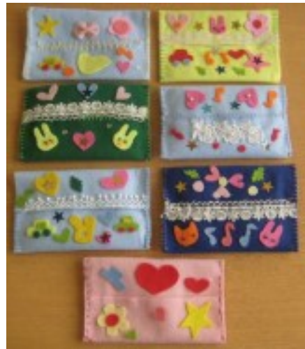
フェルト作品 ティッシュケース