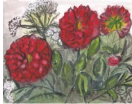
絵画教室「ダリア」 荒木弘子様 作品

毎年、三楽園の玄関に作られるツバメの巣から多くのツバメが巣立って行きました。今年もカラスにでも襲われたのでしょうか、何度作っても壊されてしまいました。何とか巣を守りヒナに巣立ってほしいと、利用者様に教わったカラス対策の棒とヒモを取り付けたところ、壊される事もなく、無事に4羽のヒナがかえり、すくすくと大きく育ち今にも飛び立とうとしています。利用者様も運動を兼ねて見に行かれ、「えらいいな〜」と大きくなったな〜と温かく見守られています。 尚、7/18に無事巣立ちました!