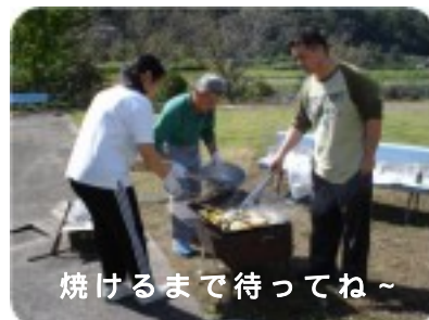
焼けるまで待ってね～

10月4日、杵築のマルシヨクヘシヨッピングに行きました。参加者は6名。皆さん楽しみにされていたようで、前日から着ていく服を選んでいる方もいらっしゃいました。