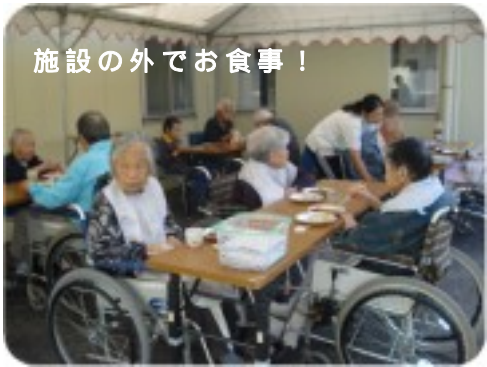
施設の外でお食事！

「肉だけじゃなく、いなりやおにぎりも出たんで。じゃけど、お肉や野菜を食べよったら、いなり一個しか食