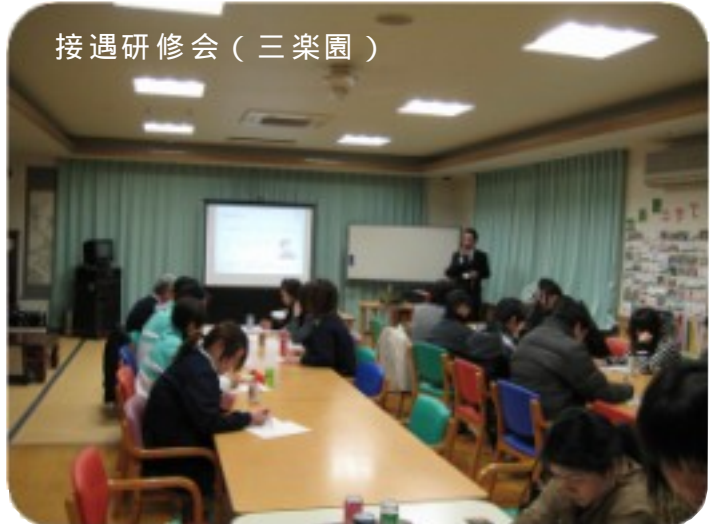
接遇研修会(三楽園)

11月28日、三楽園にて講師の方をお招きし、接遇マナーについての勉強会を開催いたしました。衛藤外科ならびにひまわりの今年度採用職員を対象に「社会人としての挨拶」、「言葉遣い」など基本的な項目の研修を行いました。 利用者様をはじめ関係機関の方々に気持ちの良い態度で接することができるよう、初心に帰る良いきっかけとなりました。