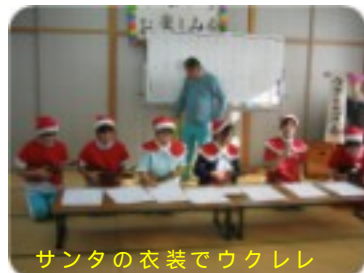
サンタの衣装でウクレレ