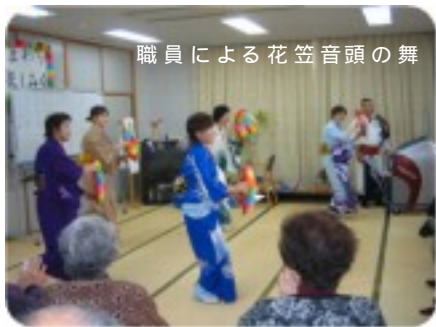
職員による花笠音頭の舞

笠音頭・トドのショーと盛りだくさん。そしてメインはひまわり相撲です。迫力とユーモアある取り組みに一同大爆笑。昼食もひまわりバイキングと沢山の御馳走が出て一年を飾るにふさわしい行事となりました。 また来年も皆様と一緒に楽しく過ごせましょう、職員一同頑張りたいと思っております。