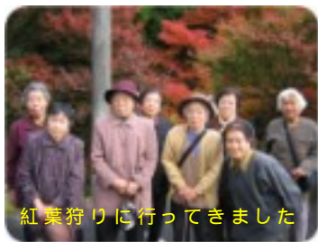
紅葉狩りに行ってきました

寒さも厳しくなってきた今日この頃です。皆様、風邪などひかれていませんか？ 気がつけば今年も残すところわずかとなりました。一年が経つのが早いな〜とつくづく感じていきます。 さて、きつきの里デイサービスでは11月下旬から両子寺、山香農業文化公園・甲尾山へ紅葉狩りに行きました。車内から見える美し