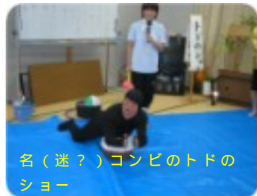
名(迷?)コンビのトドのショー